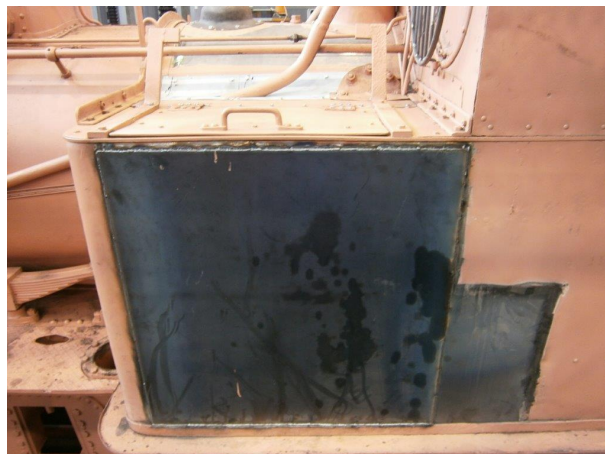
Abbildung 4: Netinera - Windt

Die rostzerfressenen Bleche der Kohlekästen wurden entfernt und durch Reparaturbleche ersetzt. Ein Verfahren, welches auch zur Betriebszeit der Lok angewendet wurde.