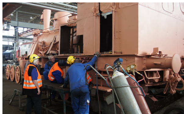
Abbildung 2: FDTM -P. Sander

Die Mitarbeiter der Firma Netinera und des AK Eisenbahn begutachteten die vorgenommenen Arbeiten.