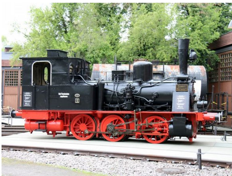
Abbildung 11: FDTM - F.Gründer

Mit der Unterstützung der Mitarbeiter der Anschlußbahn wurden noch fehlende Teile, Schilder und Leuchten angebracht. So präsentiert sich Pauline komplettiert für die feierliche Übergabe am 10. Mai 2017.