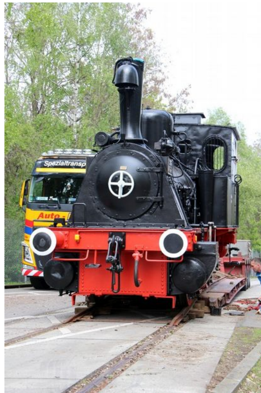
Abbildung 9: FDTM -F.Gründer

Mit der Unterstützung der Mitarbeiter der Anschlußbahn wurden noch fehlende Teile, Schilder und Leuchten angebracht. So präsentiert sich Pauline komplettiert für die feierliche Übergabe am 10. Mai 2017.