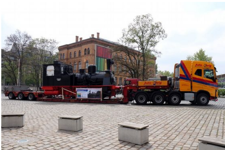
Abbildung 10: FDTM -F.Gründer

Auf dem Sattelschlepper kam Pauline Anfang Mai 2017 in neuem Glanz in Berlin und auf den Gleisen der Anschlußbahn des Technikmuseums an.