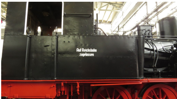
Abbildung 8: FDTM - D. Brüggemann

Auch die Beschriftung wird nach alten Fotos rekonstruiert. Leider geben die alten Fotos nicht alle Details wieder, daher ist das T3-Team dabei, nach alten Fotos zu fahnden, die vor 1966 aufgenommen wurden. Sollten Sie aussagekräftige Bilder besitzen, freut sich das T3-Team auf Informationen!