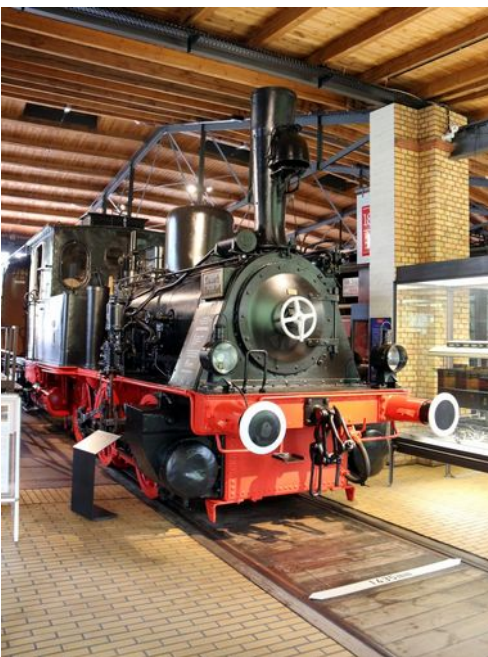
Abbildung 15: FDTM - F.Gründer

Nun kann Pauline an ihrem alten Platz in neuem Farbkleid von den Besuchern des Museums bewundert werden.