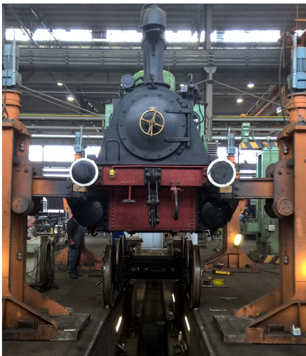
Abbildung 1: SMIDAK - Meyer

Bevor unsere GASAG-Werklok 1 im Jahr 1987 in den Ringschuppen des Museums kam, hatte sie längere Zeit im Freien gestanden. Die dadurch verursachten Rostschäden sollten nun beseitigt, verlorene Schilder ergänzt und die Lok wieder ihre originale schwarze Farbgebung erhalten und metallisch-blanke Treibstangen. Ermöglicht wurde das durch eine großzügige Spende der GASAG und Mittel und Arbeitseinsatz der Freunde und Förderer des Deutschen Technikmuseums Berlin e.V. und dessen Arbeitskreis Eisenbahn.