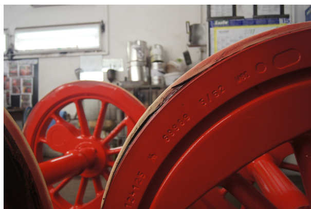
Abbildung 6

Die Radsätze und das Fahrwerk der T3 erstrahlen in neuer Farbe.