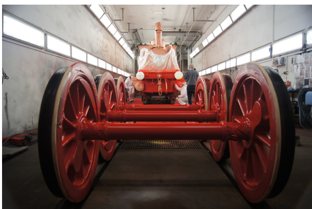
Abbildung 5: FDTM - P. Sander

Die rostzerfressenen Bleche der Kohlekästen wurden entfernt und durch Reparaturbleche ersetzt. Ein Verfahren, welches auch zur Betriebszeit der Lok angewendet wurde.