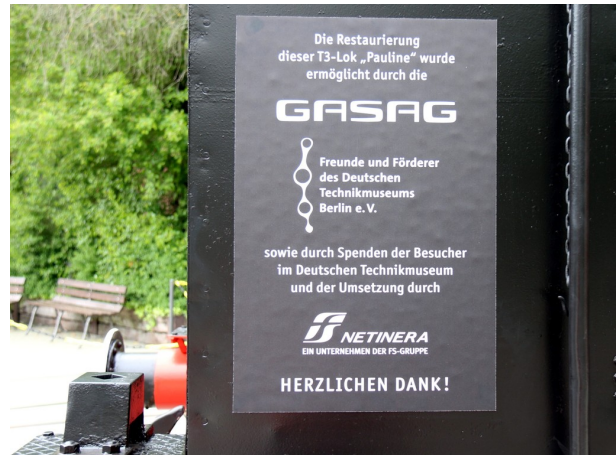
Abbildung 12: FDTM - F.Gründer

Auch ein Hinweis auf die Sponsoren darf nicht fehlen: Es waren unter anderem die vielen Spenden unserer Museumsbesucher – besonders an den Tagen der offenen Tür im Depot an der Monumentenstraße - die diese Aufarbeitung erst möglich gemacht haben. Selbstverständlich auch durch die Beiträge der Vereinsmitglieder und dem Hauptsponsor der GASAG. Ihnen allen gilt unserer Dank!